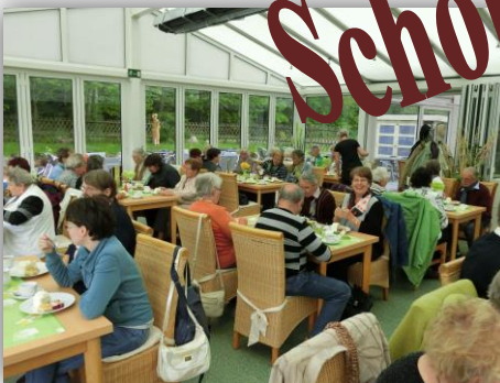
Lauenhain „Zum Talgut“